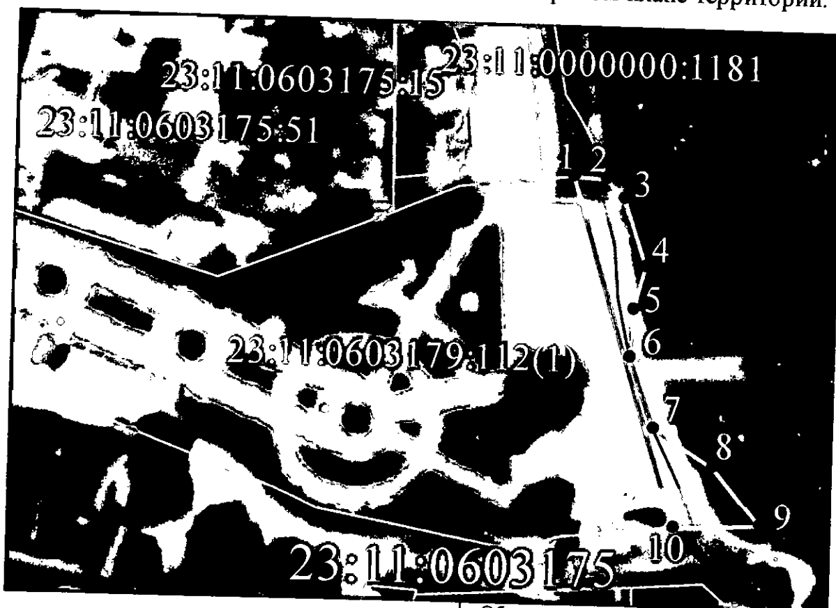
СХЕМА расположения земельного участка на кадастровом плане территории.