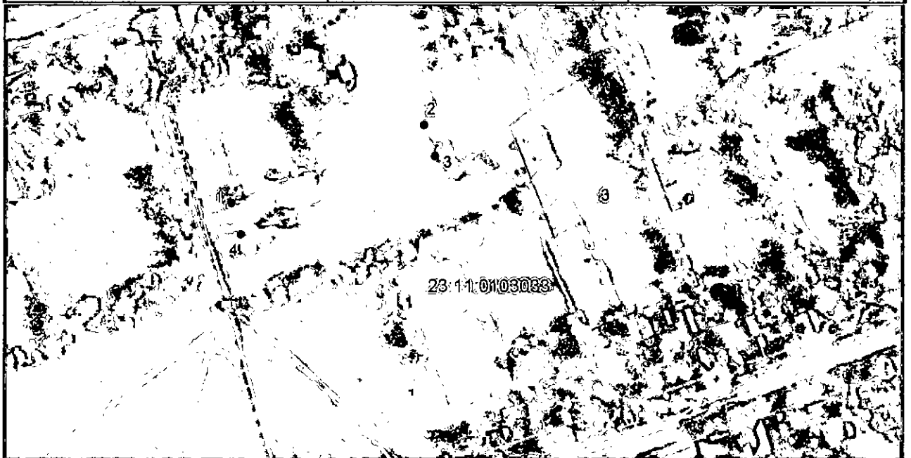
Система координат: МСК 23, зона 1 Масштаб 1:2000