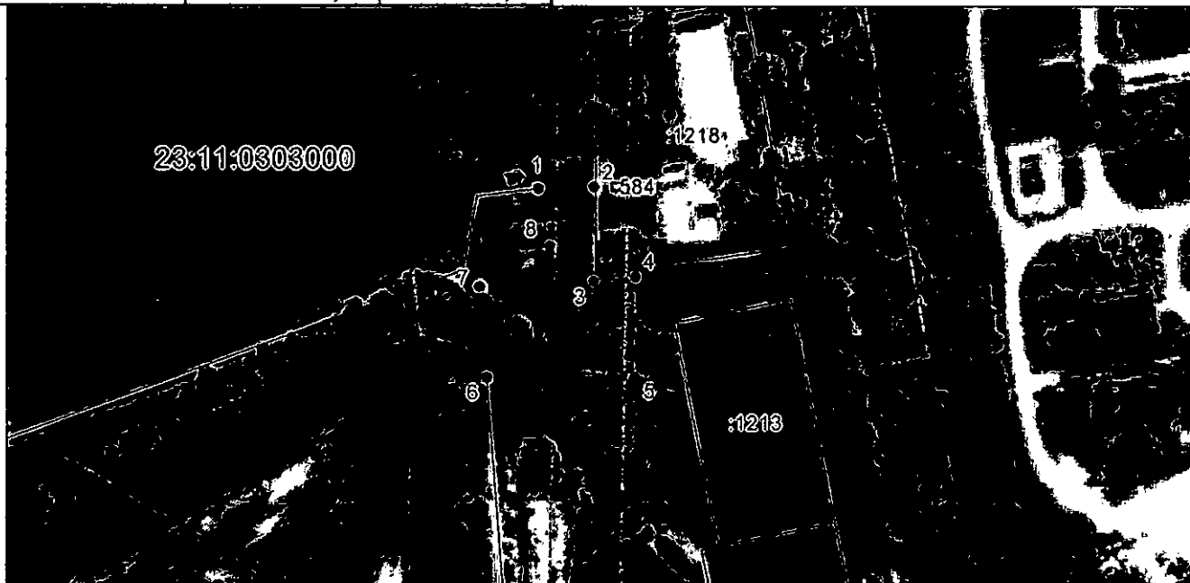
Система координат: МСК-23, зона 1 Масштаб 1:2000