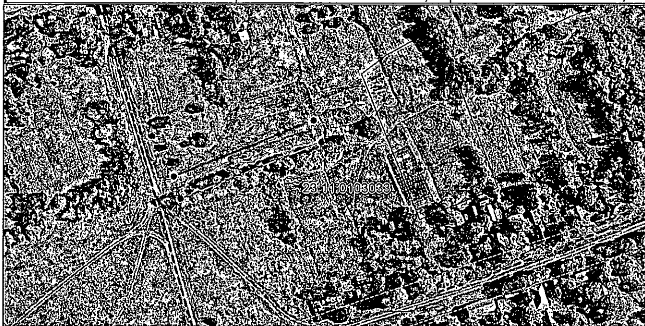
Система координат: МСК 23, зона 1 Масштаб 1:2000