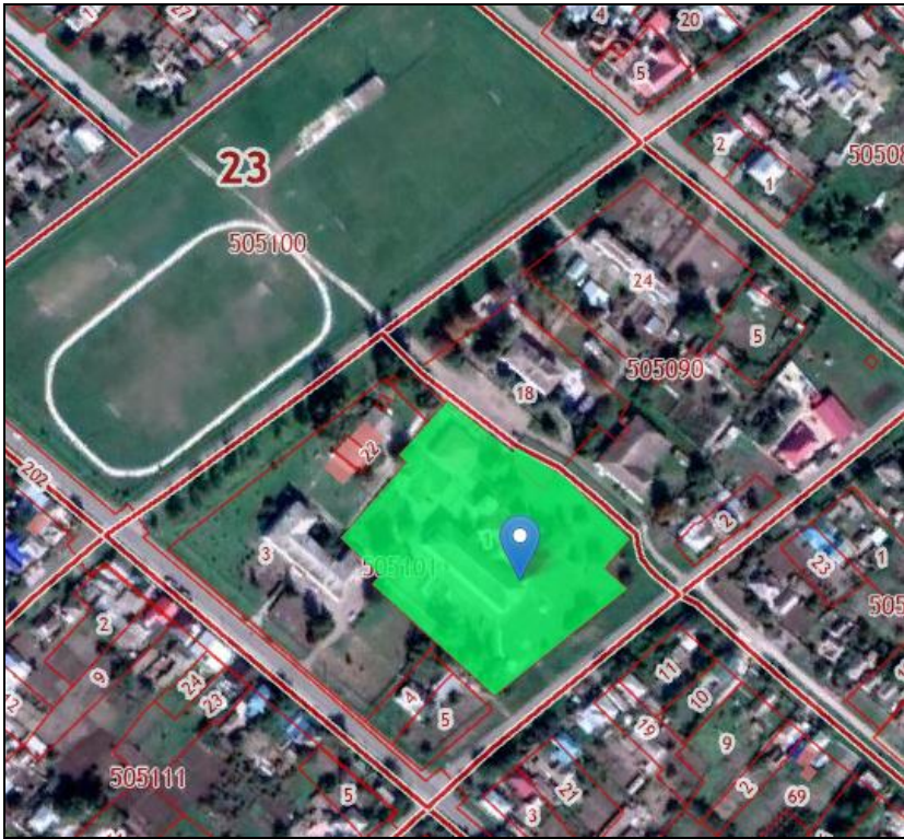
Рис. 1. Расположение второй зоны округа ГСО