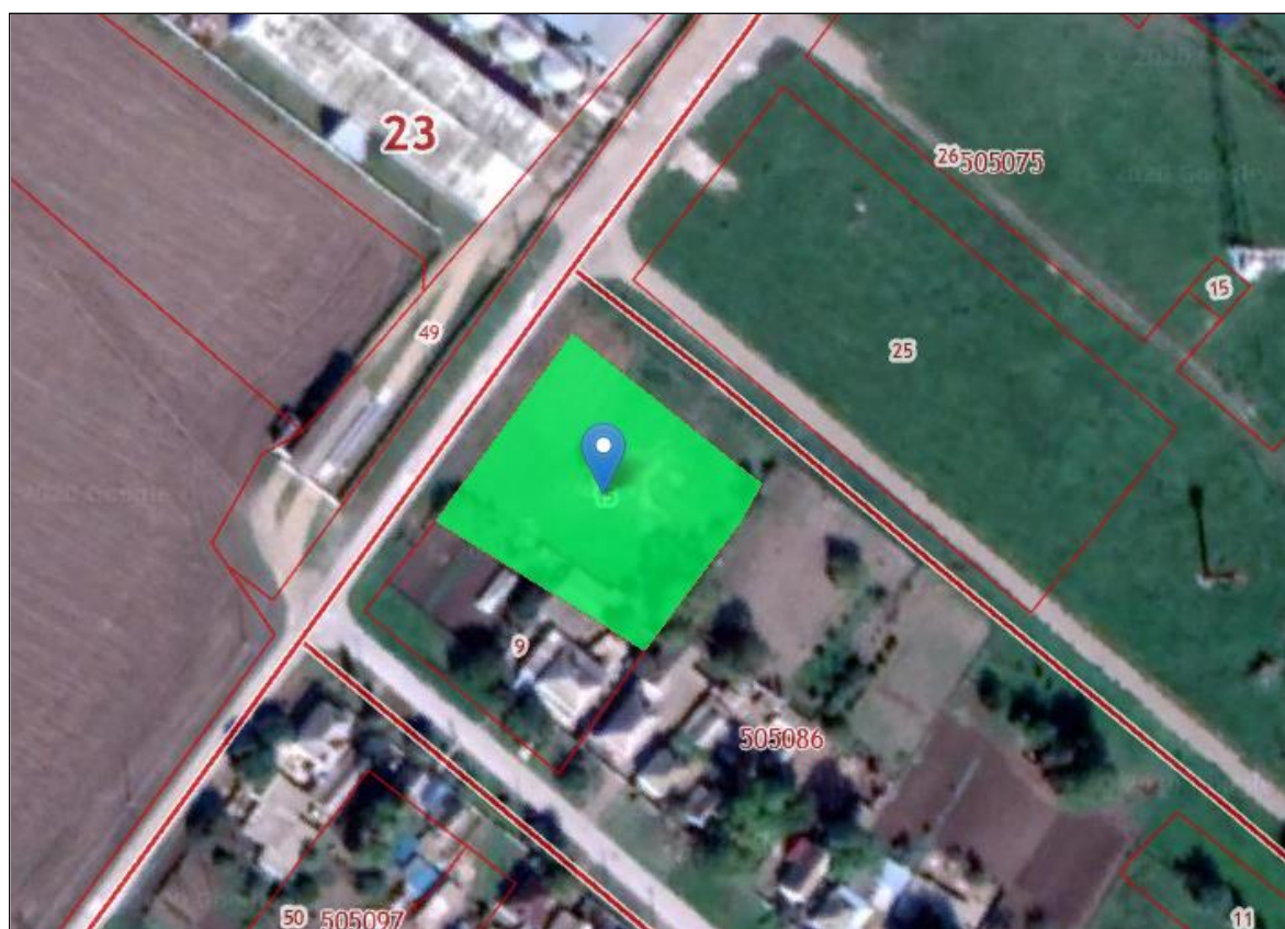
Рис. 2. Расположение первой зоны округа ГСО

Участок № 4 – устанавливается для охраны скважины № 1-86 с минеральной водой (рис. 2).